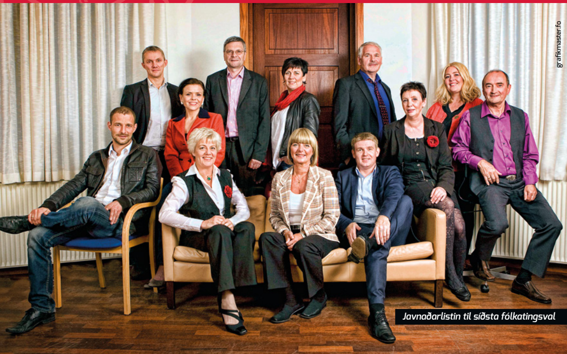
Javnaðarlistin til síðsta fólkatingsval

Leggur tú alla tína tíð og alla tína orku í fólkatingssessin, so kann nógv koma burturúr. Serliga um ítøkilig úrslit og samstarv verða tikin fram um partapolitiskar markeringar.